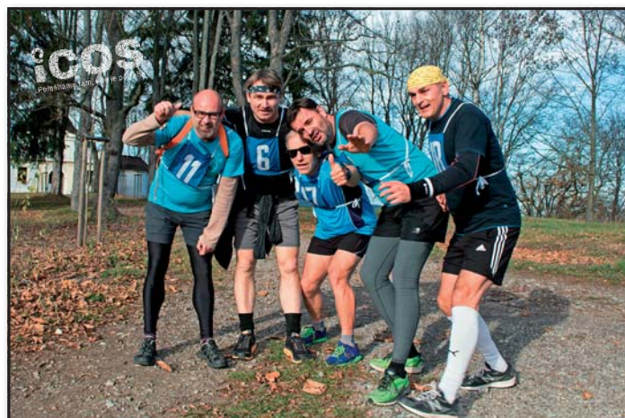
Momentka z nultého ročníku Krumlovské 11 v listopadu 2018.

Letos jako hlavní organizátoři pevně věříme, proběhne Krumlovská 11 již opět v plné parádě, znovu ve skvělé atmosféře a za účasti mnoha krumlováků. I tentokrát půjde veškerý výtěžek z akce na podporu Osobní asistence. Zejména počet seniorů, kteří potřebují asistenci, poměrně strmě narůstá. Osobní asistence jim v mnoha případech umožňuje zůstat v domácím prostředí, aniž by museli využívat ústavních zařízení, pečujícím rodinám zajišťuje potřebný oddech či vůbec možnost, přes náročnou péči o své blízké, věnovat se své práci, koníčkům. Každá hodina navíc je pro naše klienty i jejich rodiny tedy skutečným darem.