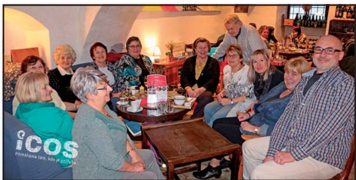
Někteří z dobrovolníků našeho centra pro seniory při každoročním setkání dobrovolníků v Egon Cafe.

Rádi hledáme individuální možnosti u každého zájemce o dobrovolnictví. Máme několik daných programů, ale nebráníme se ani dalším. Mnozí dobrovolníci pomáhají pravidelně, třeba jednou týdně, jiní ale třeba jen párkrát do roka.