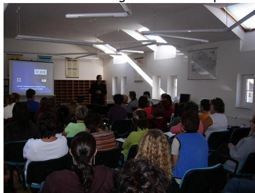
Fotografie pochází ze semináře "Antidiskriminační opatření v praxi" z 21.9.2007 (viz str.11).