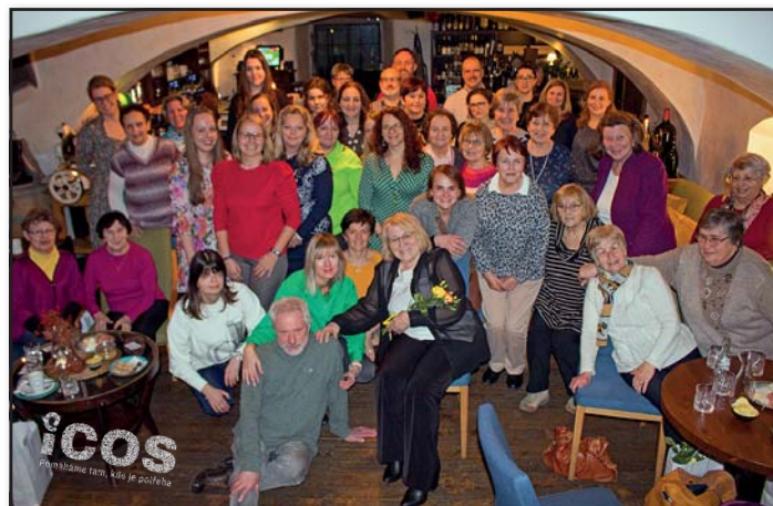
Z pravidelného výročního setkání našich dobrovolníků.