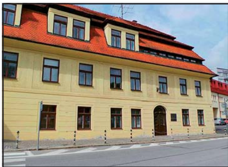
Poradenské informační centrum pro seniory je součástí obecně prospěšné společnosti ICOS, která sídlí v historické budově na ul. 5. května 251, Plešivec, Český Krumlov

Poradenské informační centrum má prostory v sídle obecně prospěšné společnosti ICOS Český Krumlov. Adresa: ul. 5. května 251, 381 01 Český Krumlov