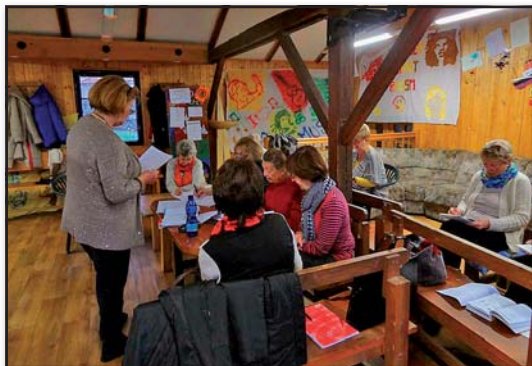
Jeden z kurzů Anglického jazyka, IC Senior Český Krumlov

Bohaté měsíční programy najdete vždy na stránkách obecně prospěšné společnosti ICOS Český Krumlov - www.icos.krumlov.cz , která provoz centra, které funguje v sídle ICOS v ul. 5. května 251, Plešivec, zajišťuje. Na chodu centra, plánování a přípravě akcí se význam-