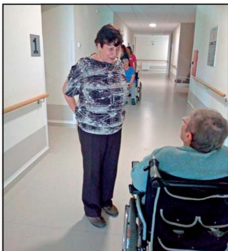
Dobrovolníci pomáhají například v domovech pro seniory a nemocnici

Pod Dobrovolnickým centrem pomáhá pravidelně více než pět desítek dobrovolníků, cirká třetina z nich jsou dobrovolníci v seniorském věku. Dobrovolníci pomáhají v nejrůznějších programech, například v dětském domově,