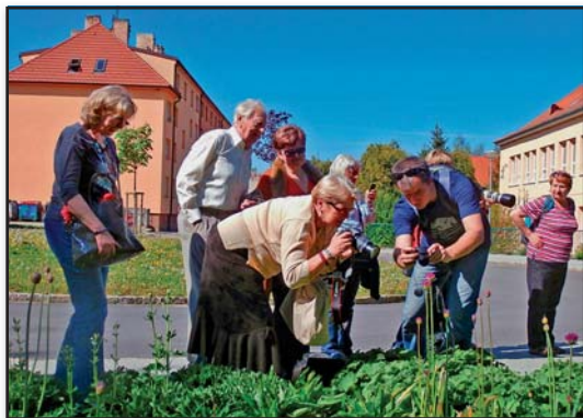
Focení v terénu, Hyalit, z.s.

V roce 2016 pak pod patronací Jihočeského kraje a ve spolupráci se Základní uměleckou školou v Kaplici vznikla „ Akademie umění a kultury (vzdělávání 3. věku) “. Členové Hyalitu od té doby navštěvují již druhý cyklus kombinovaného studia, které je zaměřeno na dějiny umění a kultury. Teoretické přednášky jsou pravidelně doplňovány praktickými lekcemi (linoryt, glazování hrnků, malování na textil, fotografování v terénu, malování) a tematickými výlety do okolí. Výsledky této činnosti mohou občané Kaplice pravidelně vidat vystavené ve výkladní skříni v ulici Nové Domovy. Speciální výstava proběhla v říjnu 2018, kdy byly vystavené exponáty nabídnuty k prodeji a výtěžek byl věnován na činnost sociální služby Sociální rehabilitace TOLERANCE při Charitě v Kaplici.