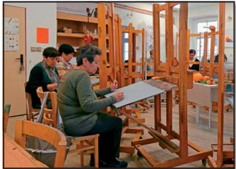
Malování v ateliéru, Hyalit

IC senior funguje na dobrovolnické bázi v Krumlově již od roku 2010 a dobrovolníci z řad seniorů připravují na každý měsíc bohatý program, jehož součástí jsou pravidelné i jednorázové vzdělávací, pohybové a další akce. Od roku 2018 je IC senior součástí širšího Poradenského informačního centra pro seniory, které provozuje obecně prospěšná společnost ICOS Český Krumlov.