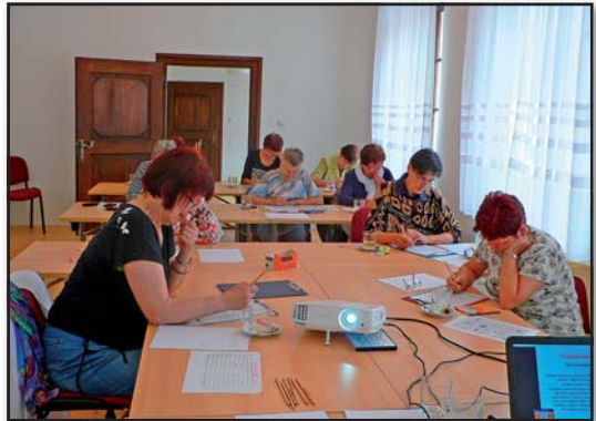
Trénování paměti, Městská knihovna Český Krumlov

Knihovna připravuje celou řadu vzdělávacích aktivit, například oblíbený kurz trénování paměti - mozkového joggingu či počítačové kurzy. Hostí také Akademii III. věku (zajišťovaných obecně prospěšnou společností Sociální služby SOVY). Seniři mohou navštěvovat přednášky o zdravém životním stylu, historii, umění, kultuře, různá autorská čtení, koncerty a mnoho dalších zajímavých akcí.