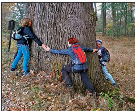
Pohybová aktivita ☺ při výletu, IC Senior Český Krumlov

IC senior je dobrovolníky z řad seniorů vedený klub, který funguje v Krumlově již od roku 2010.