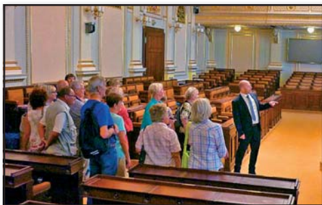
Exkurze, Senior klub, Loučovice

Loučovický Senior klub zahájil svou činnost teprve v roce 2018 (květen), i tak se ale může pochlubit širokou nabídkou volnočasových aktivit. Jednou z nich je i organizace jednodenních zájezdů pro místní seniory (pravidelně 2x do roka). Klub pořádá také rehabilitační a rekondiční cvičení pro loučovické seniory.