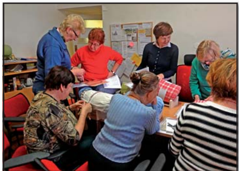
Dobrovolníci z IC senior při rukodělné práci, IC senior