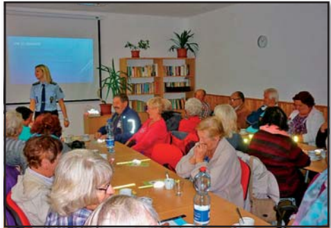
Bezpečnost seniorů, Senior klub Loučovice

Realizuje besedy (téma bezpečnosti seniorů), plánuje počítačové kurzy pro seniory.