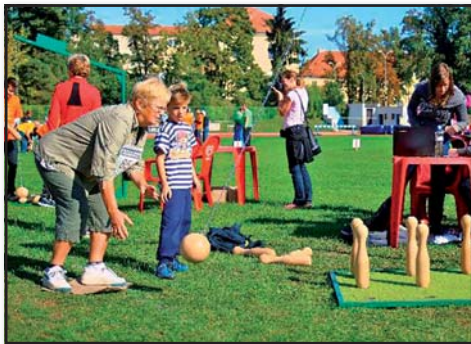
Spolek aktivních seniorů

Klub funguje od roku 2011 a nabízí každý měsíc nějakou akci. Co se týká sportu, pořádá soutěže v metané, či bowlingu. Dvakrát do roka pořádá klub také zájezd (exkurze v muzeích, památky ad.).