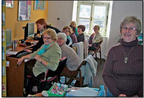
PC kurz, IC Senior Český Krumlov

Klub pořádá přednášky například o cestování.