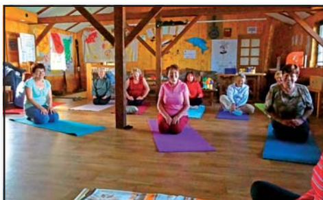
Pravidelné cvičení v Boudě, IC Senior Český Krumlov