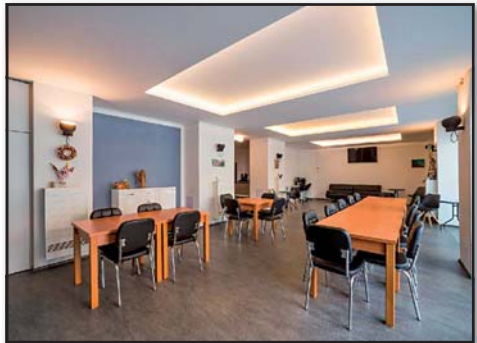
Prostory klubovny, Senior klub, Sociální služby SOVY, o.p.s.

Kurzy ručních prací, posezení s hudbou, vystoupení, zájemci mohou využít i pravidelné provádění masáží na bolavá záda či parafinových zábalů pro úlevu od bolesti a únavy.