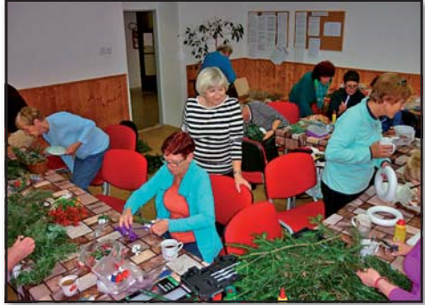
Tvořivá dílna, Senior klub, Loučovice

Organizuje vánoční tvoření, promítání starých filmů (práce se vzpomínkami), vánoční posezení, kreativní tvoření (pletení z papíru, suchá vazba, ubrousková technika), koncerty vážné hudby - violoncellového dua, posezení s živou hudbou a další aktivity.