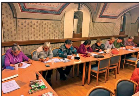
Trénink paměti, IC Senior Český Krumlov