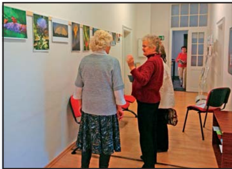
Z vernisáže výstavy fotografií, IC senior

Pořádá 1x za 2 měsíce setkání seniorů s hudbou a tancem, cirka 1x do roka pak přeshraniční setkávání se seniory z Rakouska a Německa.