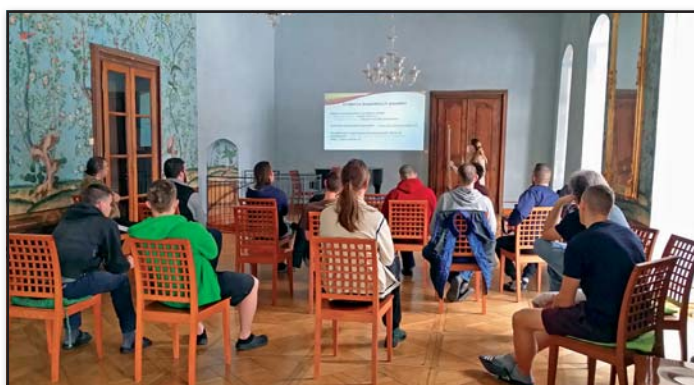
Každý rok poradna navíc pořádá několik informačně vzdělávací akcí.