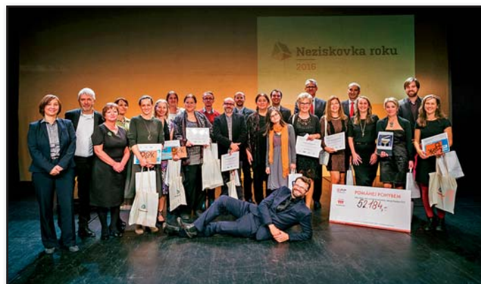
Momentka ze slavnostního vyhlášení cen Neziskovka roku 2016 v pražském divadle Archa.