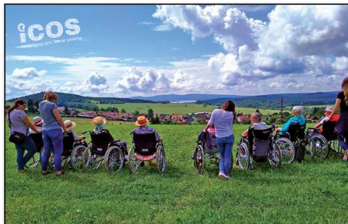
Z výletu, kteří dobrovolníci zorganizovali pro klienty domova pro seniory

„Za 13 let fungování Dobrovolnického centra jsme potkali nespočet úžasných lidí, kteří jsou ochotni věnovat svůj čas druhým. Velmi si vážíme všech, kteří pomáhají tam, kde je potřeba. Věříme, že i pro ně je to cenná zkušenost a příležitost,“ doplňuje koordinátorka dobrovolníků Petra Tichá.