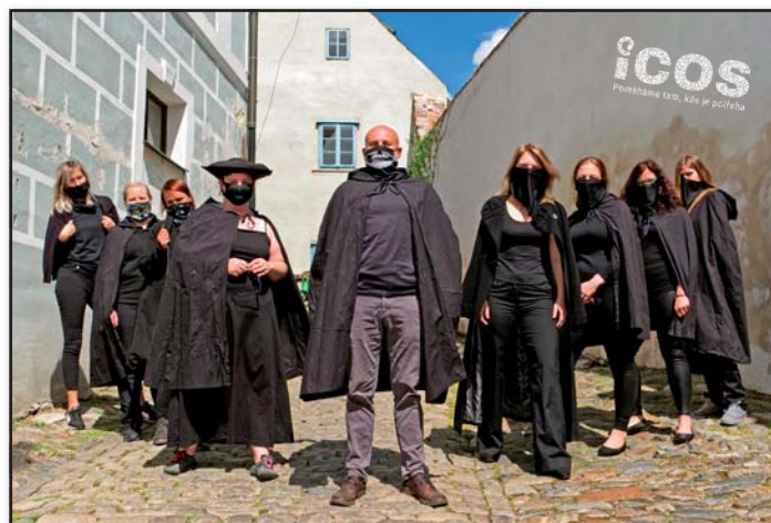
Část vedení ICOS v době koronavirové.

Od r. 2000 jsme pomohli tisícům lidí v různých těžkých životních situacích prostřednictvím šesti klíčových služeb, které jsme postupně vybudovali. Zvýšili jsme několikanásobně obrát i počet zaměstnanců. Především jsme ale společně vytvořili něco, čemu já říkám „duch ICOSu“ - a to díky