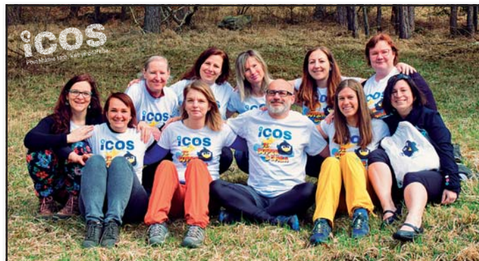
Vedoucí pracovníci ICOS Český Krumlov, o.p.s.