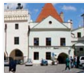
Sídlo ICOS na Náměstí Svornosti - vedení organizace, agentura práce, bezplatná právní poradna...

www.icos.krumlov.cz (sekce Osobní asistence)