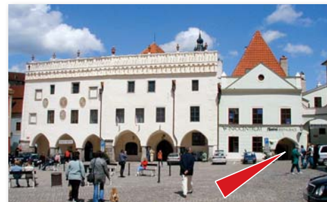
Sídlo ICOS na Náměstí Svornosti v Českém Krumlově

Podrobně k jednotlivým činnostem ICOS v roce 2013 od strany 6 dále.