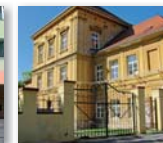
Kancelář Dobrovolnického centra a Informačního centra pro seniory Špičák 114