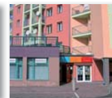
Sídlo Rodinného centra Urbinská 184