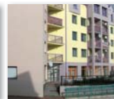
Kancelář služby Osobní asistence Urbinská 184