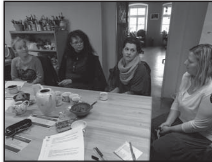
Momentka ze supervizního setkání

„O dobrovolnictví jsem začala uvažovat už dřív, ale až po nástupu do zaměstnání s pravidelnou pracovní dobou jsem to mohla začít realizovat. Dobrovolnictví beru jednak jako pomoc dětem, jednak jako seberealizaci - „tělocvik pro dušičku“. A nakukal mi to KUK (krumlovský kulturní kalendář). Moje děti říkaly, že už se nemám na koho doma vytažovat... Ale vážně: můj manžel i děti o mně ví, že jsem chtěla být učitelkou, a asi berou dobrovolnictví jako lepší variantu chození do knihovny.“