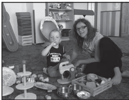
Dobrovolnice v rodinném centru

Rodinné centrum Krumlík je jedním z pracovišť ICOS Český Krumlov, o.p.s. Do jeho činnosti zapojujeme poměrně velké množství dobrovolníků. Díky nim může centrum fungovat v takovém rozsahu, jak funguje. Dobrovolníci, především z řad maminek na rodičovské dovolené, vypomáhají s organizačními záležitostmi v charitativním bazárku, nebo v tzv. volné herně a kavárničce. Celý přátelský kolektiv centra vítá jakoukoliv pomoc ze strany dobrovolníků. Velmi si cení každého z nich a rádi je přijmou do svého týmu. Jen v roce 2015 vypomáhalo v Rodinném centru 16 dobrovolnic.