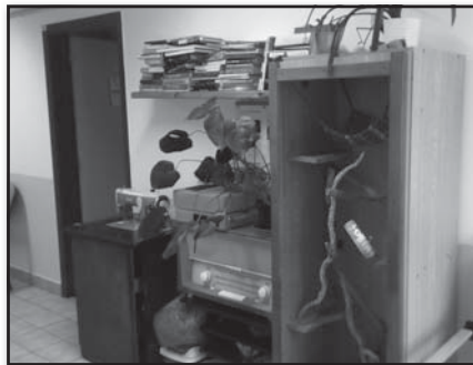
Tzv. retro koutek v Domově pro seniory Kaplice