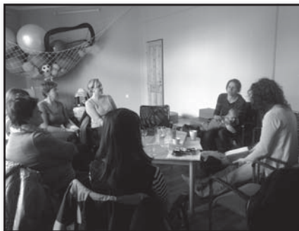
Momentka ze supervizního setkání v rodinném centru