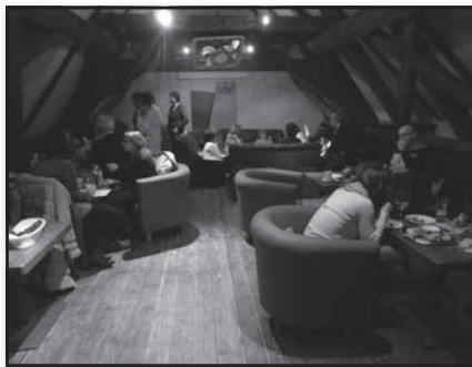
Fotografie ze setkání dobrovolníků Dobrovolnického centra v roce 2015