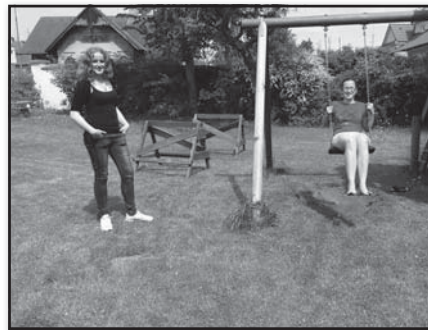
Dobrovolnice a klientky v programu Kamarád v životě