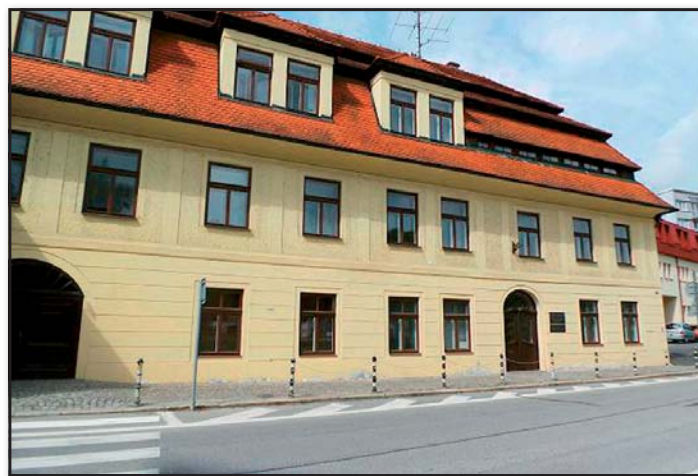
Sídlo ICOS Český Krumlov a jeho Bezplatné poradny mezi paragrafy, ul. 5. května 251, Plešivec