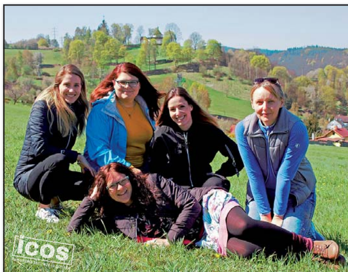
Základní pracovní tým služby Podpora rodin a dětí.

Provozovatel: ICOS Český Krumlov, o.p.s.