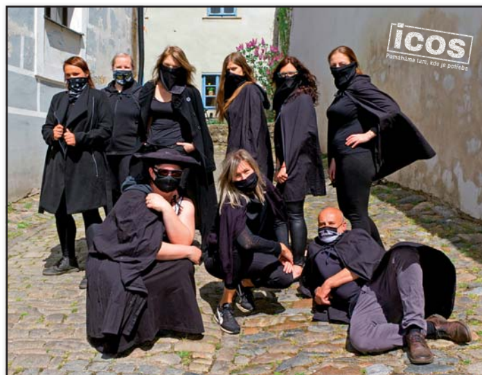
Vedení ICOS v době koronavirové

Samozřejmě i my dostáváme i od státu poděkování za činnost našich služeb v koronavirové době, kdy například osobní asistentky musely podobně jako zdravotníci fungovat nejen naplno, ale ještě více než je obvyklé. Jen ta podpora státu i některých dalších veřejných institucí se někde jakoby maličko vytratila. A bez podpory mnoha lidí a dárců (nezřídka ze soukromého sektoru) bychom se s nelehkou situací vypořádávali