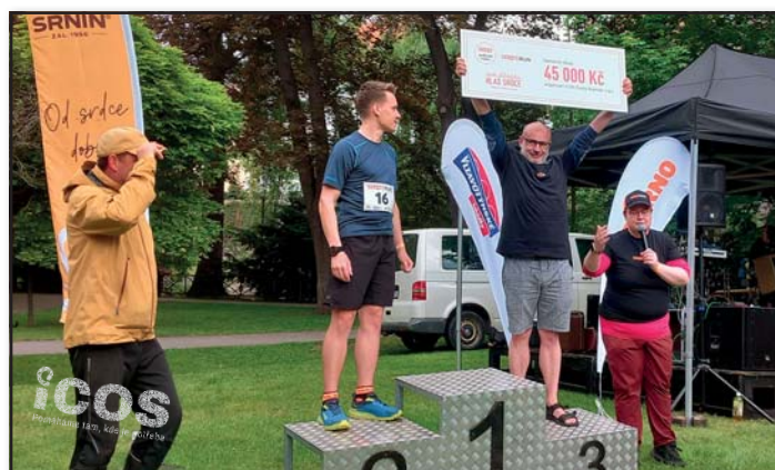
Autor: Antonín Zunt

A abychom zůstali u akcí pro Krumlováky. V sobotu 15. června srdečně zvou rodiny s dětmi na naši tradiční ICOSí slavnost: dětské