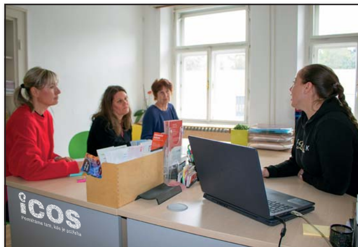
Část pracovního týmu Bezplatné poradny mezi paragrafy

Bezplatná poradna mezi paragrafy má sídlo v Českém Krumlově a pobočky v Kaplici, Trhových Svinech a Nových Hradech. Spotřebitelská tematika je pouze jednou z mnoha oblastí, kterým se poradna věnuje. Pro své dotazy můžete využít i anonymní webovou poradnu na poradna.icosck.cz .